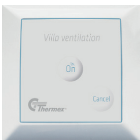
Langaton katkaisija märkätilatehostukseen.