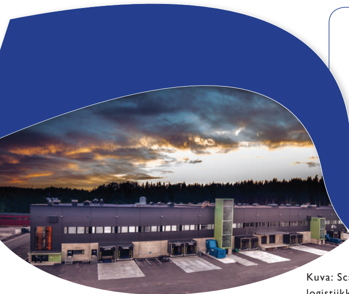
Kuva: Scanoffice Group:n vuonna 2012 valmistuneesta logistiikkakeskuksesta Vantaalla.

GREE Electric Appliances Inc:n maahantuojana Suomessa toimii Scanvarm Oy Ab. Scanvarm Oy Ab kuuluu Scanoffice Groupiin, Pohjoismaiden suurimpaan lämpöpumppujen maahantuonti- ja valmistuttaja yritysryhmään. Suomalainen Scanoffice Group on toiminut vuodesta 1984 ja sen liikevaihto ylittää 30 miljoonaa euroa. Scanoffice Groupiin kuuluvat Suomessa Scanoffice Oy sekä Scanvarm Oy Ab ja Ruotsissa ScanMont AB.