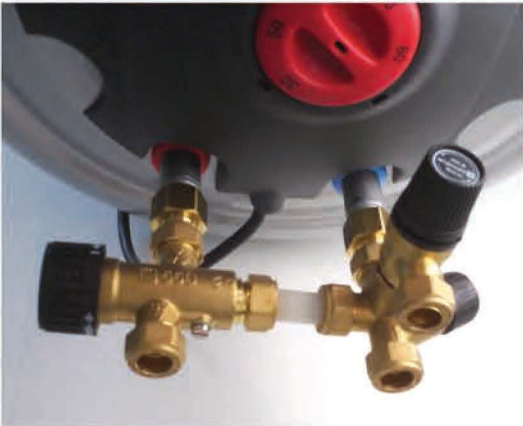
LK Armatur varolaiteryhmä termostaattisella sekoitusventtiilillä