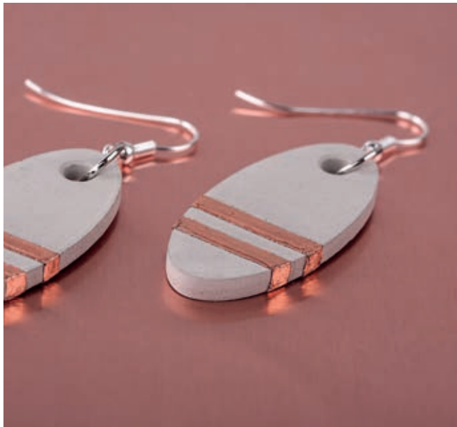
Art. 2227622 ↑

Beton-Schmuck kombiniert mit Rayher Deco-Metall in Kupfer und passenden Schmuckaccessoires – für außergewöhnliche Schmuck-Unikate.