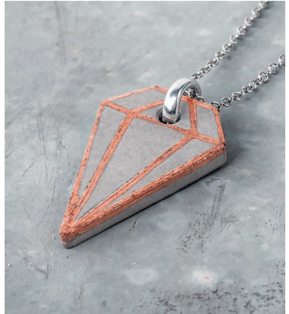
Art. 2171524 ↗