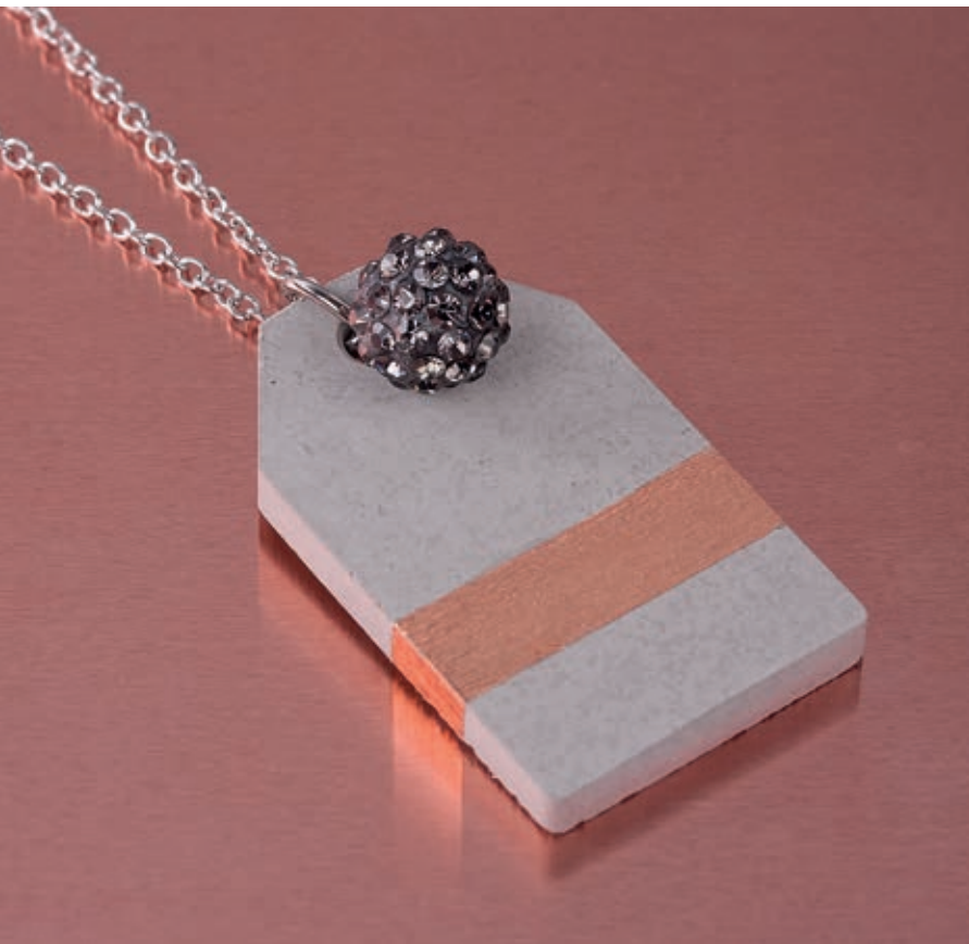
Art. 14650572 ↓